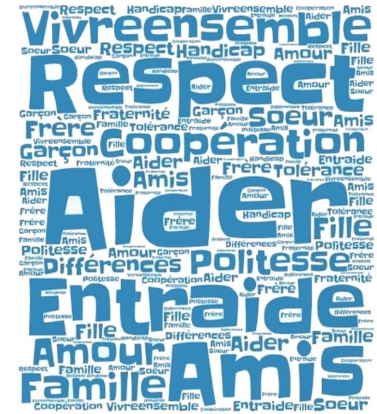
Prix de la "création numérique" - Concours affiches Laïcité 2017