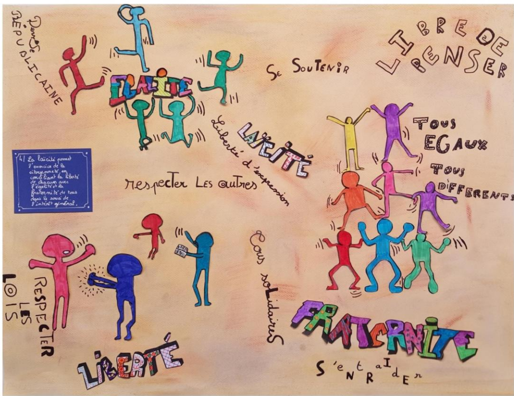
Prix de la création artistique - Concours affiches Laïcité 2017