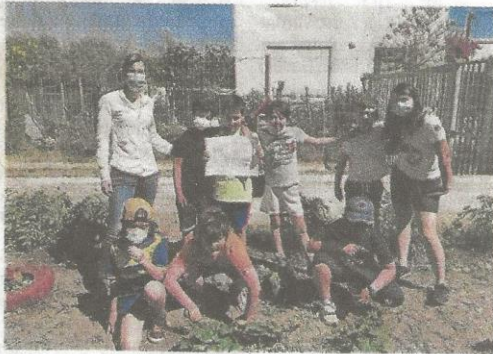
Un prix mérité pour les enfants et leur jardin de Franquevaux.

Le point de départ, un jardinet abandonné et encombré de vieux pneus sur le côté du bâtiment, un défi lancé en plusieurs étapes. « Nous avons été guidés par la conseillère de la médiathèque de la commune pour choisir les plantes adaptées à l'exposition de notre jardin, nous avons pu compter sur la solidarité des habitants et de la municipalité. Les enfants ont choisi des fuchsias, tour-