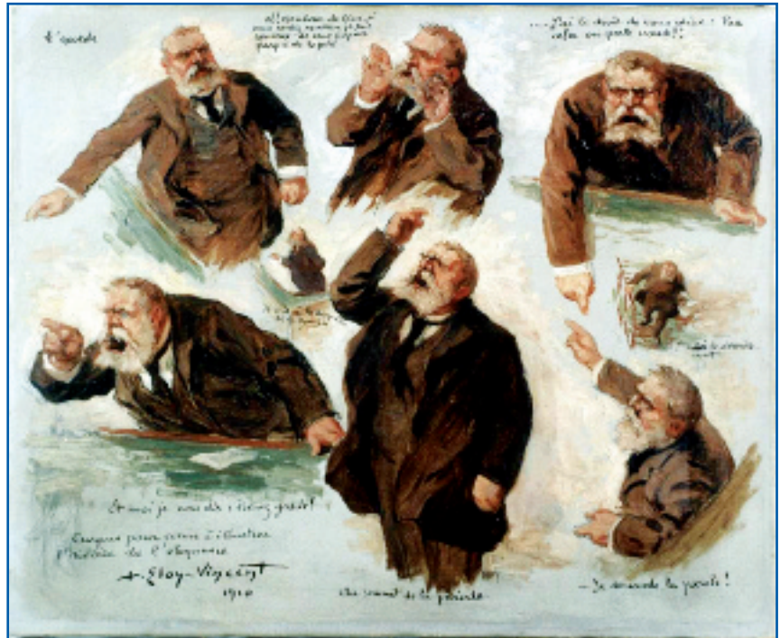
Jaurès vu par les caricaturistes.

« Entre le principe révolutionnaire de l'État et le principe révolutionnaire de la liberté individuelle, il y a harmonie ». Cette affirmation peut paraître bien naïve et faire sourire, mais Jaurès s'en explique. Depuis 1886 il affirme qu'« en matière d'enseignement philosophique et moral, l'État ne peut opposer son enseignement à la diversité de tous les esprits et de tous les milieux ». Il récuse toute philosophie d'État, tout enseignement officiel car les programmes scolaires ne peuvent être fondés que sur l'initiation à la science et à la raison. Pour lui, la laïcité républicaine n'est pas un dogme, n'est pas une religion civile, comme l'affirme encore aujourd'hui Jean Baubérot (12). Elle n'est pas un laïcisme, une idéologie d'État comme continue à l'affirmer l'Église catholique et Nicolas Sarkozy (13).